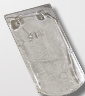
Tuile en verre PLATE 16x38 Doyet