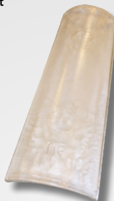
Tuile en verre CANAL