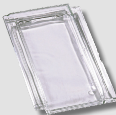
Tuile en verre HP 10 Huguenot